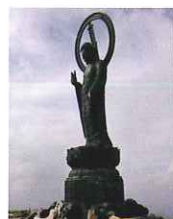
釈迦ヶ岳山頂に立つ釈迦如来像